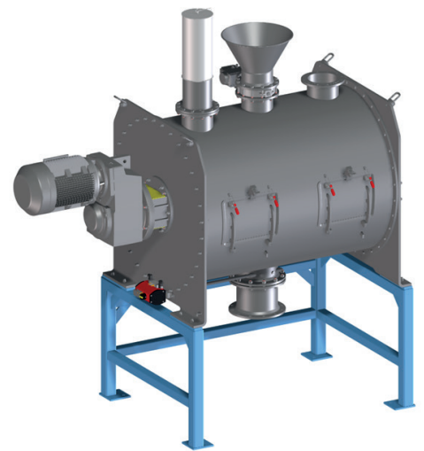
FKM 3000 LS