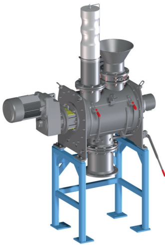
FKM 130 LS